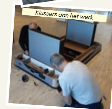
Klussers aan het werk