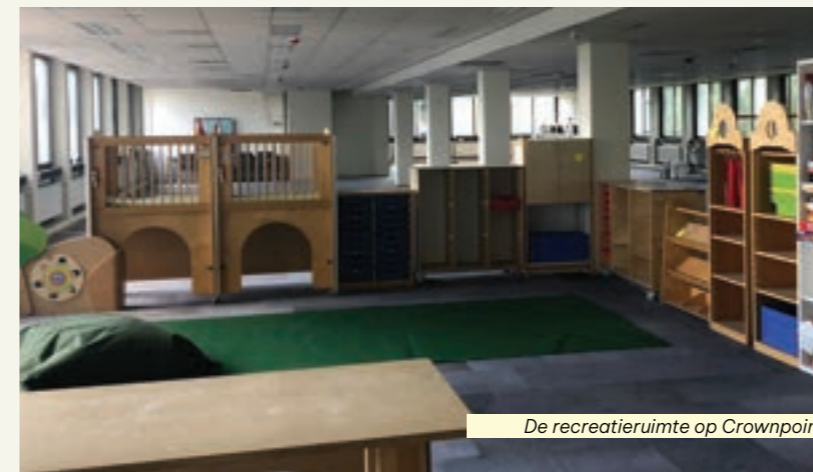
De recreatieruimte op Crownpoint