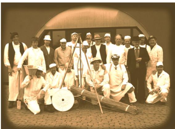
De gildeleden - vakidioten - in oude sferen (2011)

'meester-restauratiestukadoer' mogen dragen. Daarmee hebben de vakidioten van twintig jaar geleden hun plicht om het ambacht door te geven weten veilig te stellen. Veel geslaagde deelnemers van de eerste lichten zijn tegenwoordig zelfstandig met mooie projecten bezig, maar houden zich ook bezig met besturen en opleiden binnen de branche. Als je dus de in deze tijd op veel terreinen populaire vraag zou stellen of het rendabel is om op deze manier ambachtelijk en kleinschalig onderwijs